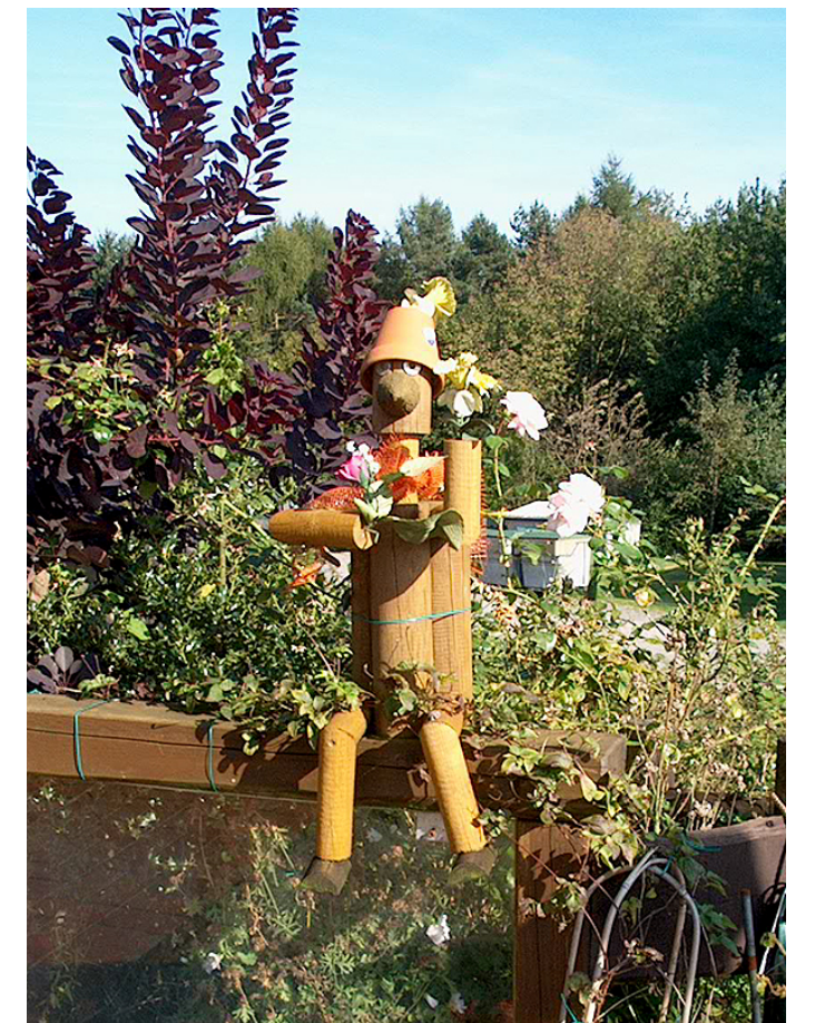
Verkleidung kann, muss aber nicht sein ☺.

Die Wanderung findet bei jeder Witterung statt. Sie wird für das Internationale Volkssportabzeichen gewertet. Nach absolvierter Strecke erhalten die Teilnehmer eine entsprechende Wertung für die IVV-Teilnahme- und Kilometerwertung gemäß den Richtlinien des Deutschen Volkssportverbandes e.V. (DVV). Die Veranstaltung ist gegen Haftpflichtansprüche Dritter versichert. Es besteht eine Unfallversicherung für Teilnehmer.