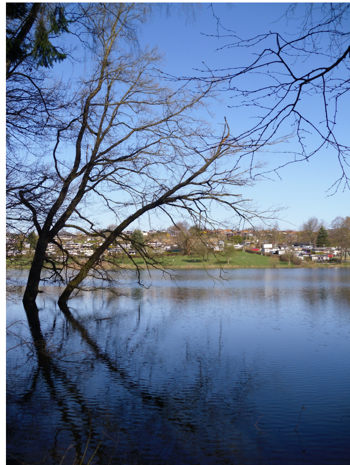
Blick über die Bevertalsperre auf die Gaststätte Beverblick

Die Wanderung findet bei jeder Witterung statt. Sie wird für das Internationale Volkssportabzeichen gewertet. Nach absolvierter Strecke erhalten die Teilnehmer eine entsprechende Wertung für die IVV-Teilnahme- und Kilometerwertung gemäß den Richtlinien des Deutschen Volkssportverbandes e.V. (DVV). Die Veranstaltung ist gegen Haftpflichtansprüche Dritter versichert. Es besteht eine Unfallversicherung für Teilnehmer.